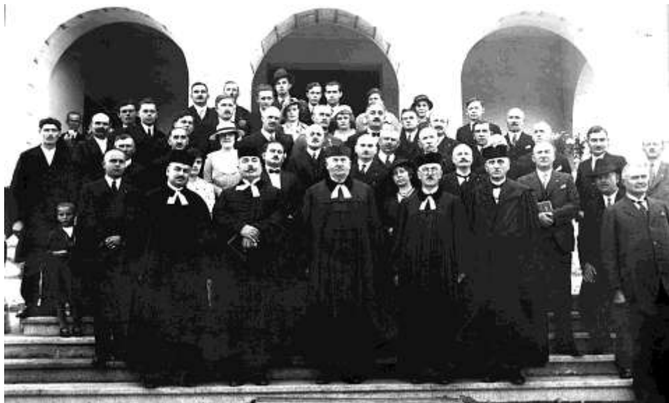
Az evangélikus templom felszentelésének résztvevői 1934. szeptember 23-án a templom lépcsőin