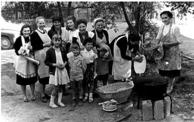
A templom 25 éves évfordulóján a gyülekezet asszonyai főztek a vendégeknek (1958)

1954-ben a nagy szórvány terület legtöbb evangélikusa 137 fő Rudabányán van, ezt követi Ormosbánya 72, Izsófalva 60 evangélikus vallású lakójával.