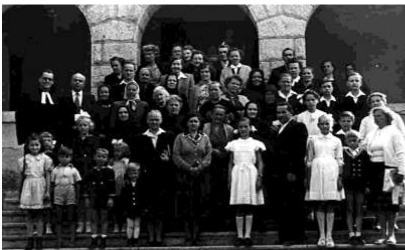
A gyülekezet 1957-ben a templom előtt