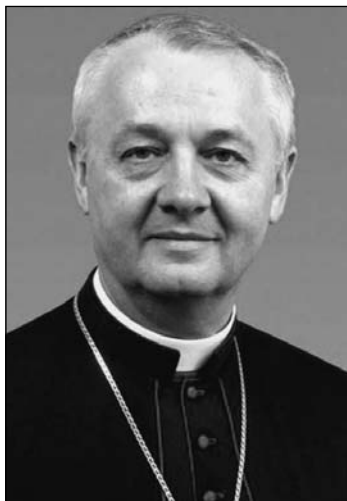
Dr. Ternyák Csaba

Ebben az időszakban, a '90-es évek elején az Egri Főegyházmegyében három óvoda, öt általános iskola, egy gimnázium és egy kollégium került vissza egyházi fenntartásba. Egyik óvodánk kivételével mindegyik az ingatlan visszaadások kapcsán került főegyházmegyei fenntartásba. Ennek az összesen tíz intézménynek a helyzete különösen az elmúlt néhány évben jelentősen különbözött, különbözik attól a másik intézményi csoporttól, amelyek 2010 után kerültek hozzánk, és amelyeknek már nem volt köze a kárpótláshoz, nem játszott benne szerepet a korábbi egyházi ingatlanok visszaadásáról szóló törvény.