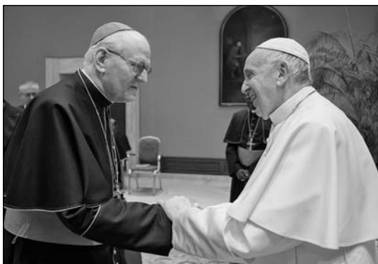
Erdő Péter bíboros Ferenc pápával

Harminc évvel ezelőtt elterjedt Magyarországon a meggyőződés, hogy el kell hagyni a szocialista rendszert és át kell térni a kapitalizmusra, vagy esetleg egy „harmadik típusú” rendszerre. Lehetett tudni, hogy a nagyhatalmaknak az a szándéka, hogy ez az átmenet békés módon menjen végbe. Tudott dolog volt, hogy az Egyesült Államok és a Szovjetunió megállapodott Máltán ennek a változásnak a főbb pontjairól. Így azután meg-